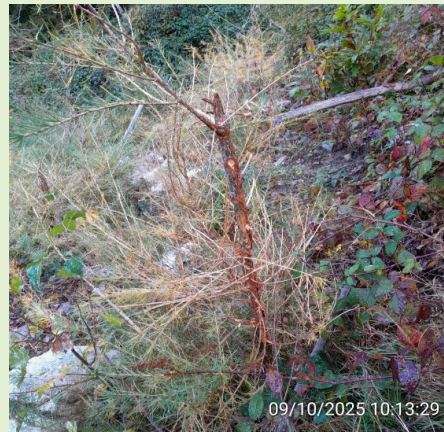
Mélèze planté en 2022 cassé par des cervidés

La préservation de cet environnement montagnard exceptionnel est un impératif pour la biodiversité et l'économie locale.